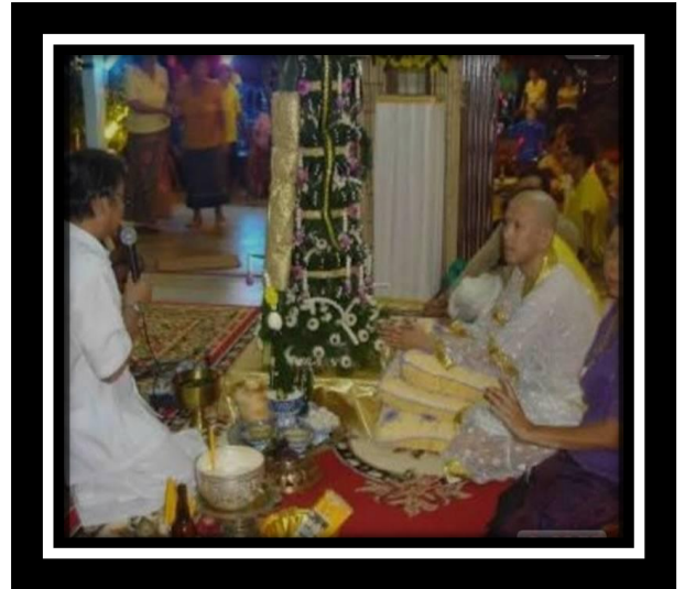
๘.๔ ชาวบ้าน ต.ชุมแสง อ.นางรอง จ.บุรีรัมย์ ภูมิปัญญาท้องถิ่นด้านความเชื่อ เลี้ยงตาปู่หมู่บ้าน